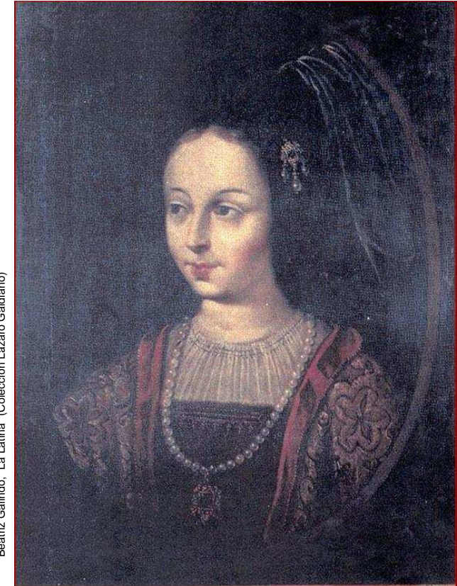
Beatriz Galindo, "La Latina" (Colección Lázaro Galdiano)